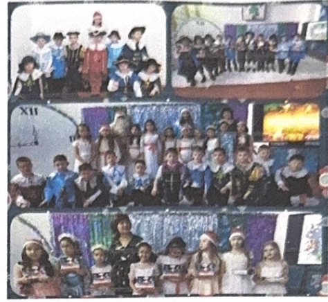
Проект «Читающая школа» - в действии! Новогодний утренник