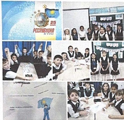
«25 октября - День Республики Казахстан»