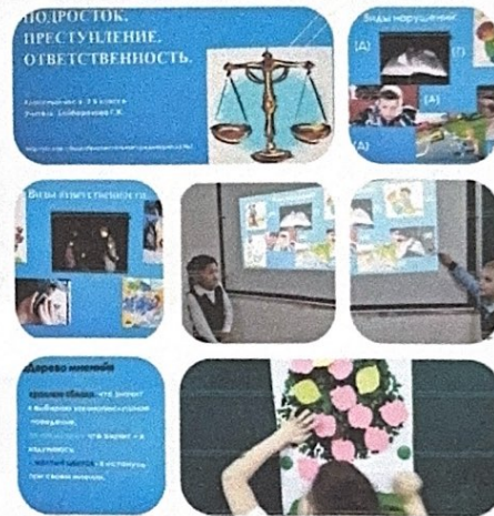
«Подросток. Преступление. «Ответственность»».