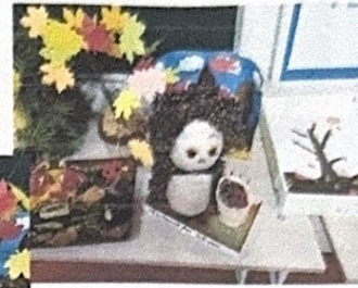
Выставка поделок из природных материалов