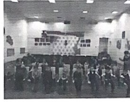
Посещение концерта ДШИ