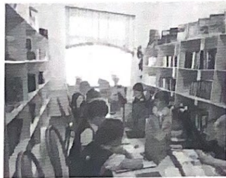
В школьной библиотеке