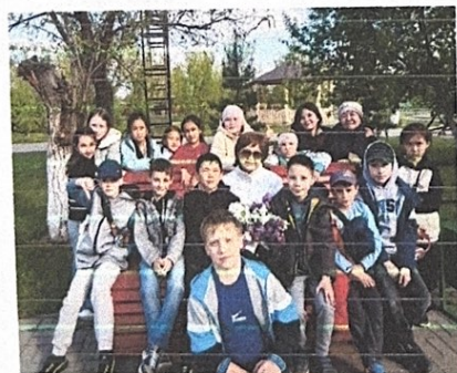
Экскурсия в парк