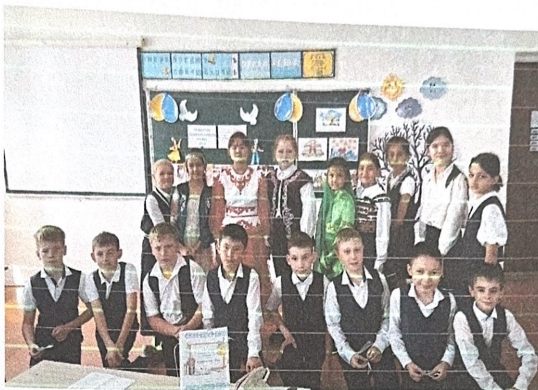
День единства народов РК