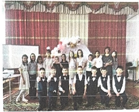
Кл. час «Мама-образец всего прекрасного»