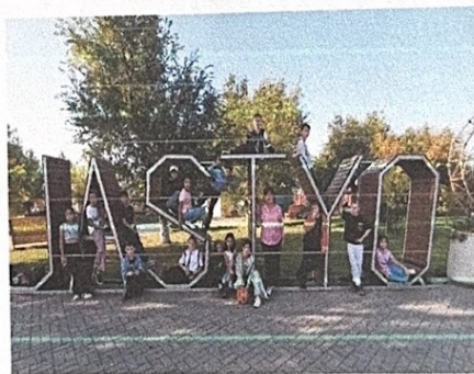
Экскурсия в парк