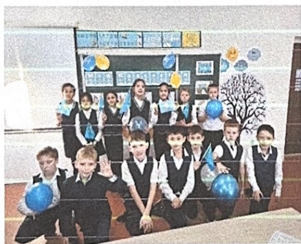
День Независимости РК