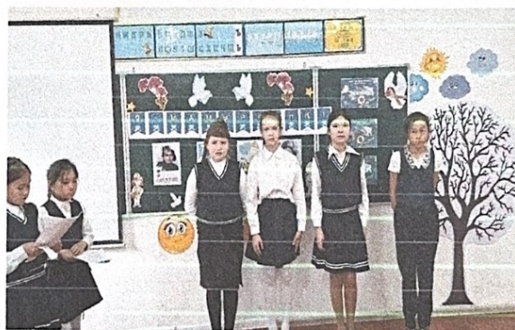
День Защитников Отечества и День Победы