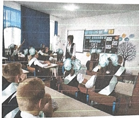
Классный час «Мои знания – Родине»