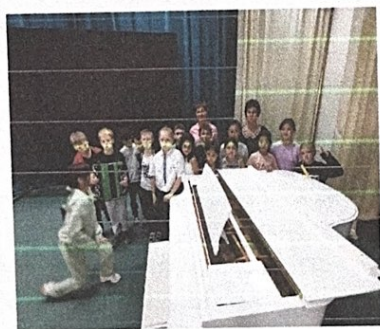
Экскурсия в Школу искусств