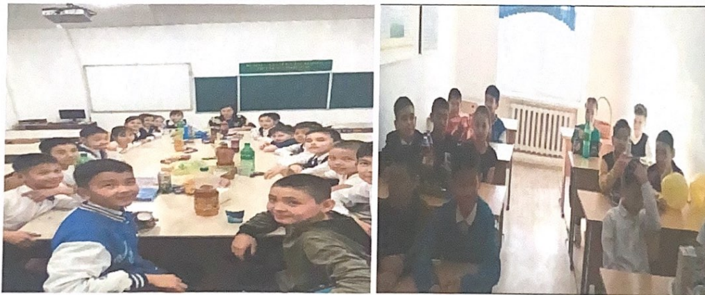
Оқушылар желтоқсан айында Жас Ұлан антын салтанатты түрде қабылдады.

Оқушылардың көңіл-күйін көтеру мақсатында сыныпта «Түрлі-түсті кеш» ұйымдастырдық: