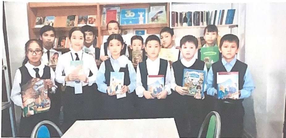
Дене тәрбиесі, салауатты өмір салты

Мақсаты: Салауатты өмір салты, дене дамуы және психологиялық денсаулық сақтау дағдыларын, денсаулыққа зиян келтіретін факторларды анықтау біліктілігін ойдағыдай қалыптастыру үшін кеңістік орнату.