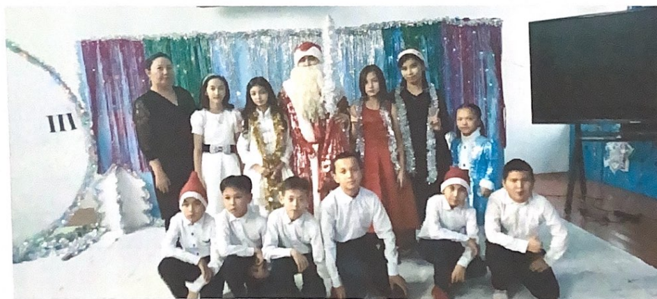
Сыныпты жалпы зерттегенде сыныпта белсенді бірнеше оқушылар бар. Сыныптағы оқушылардың бір-бірімен қарым-қатынасы өте жақсы, қалыпты.