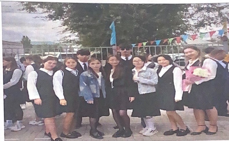
1 қыркүйек - Білім күні

Жыл қорытындысында сынып оқушылары үлгерімі 100 пайыз, сапалық құрамы 50 пайызбен аяқтады. Оқушылар осы уақытқа дейін мектептің қоғамдық іс шараларына белсене қатысты. 14.06.2024 жылы «Жолың болсын, жас түлек» атты аттестат табыстау іс-шарасы өтті. Сыныптың он оқушысы болашаққа болдама алды.