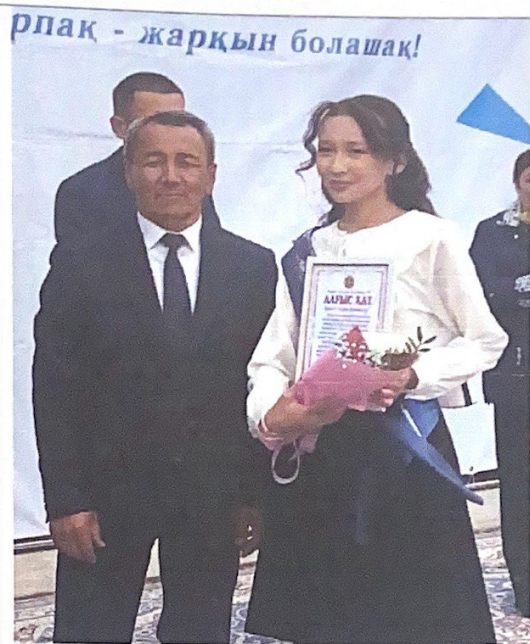
Оқушыларды марапаттау сәті