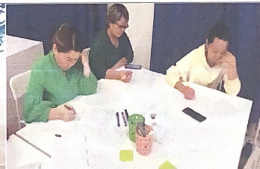
«Сен жанбасаң лапылдап...», «Балаға мамандық таңдауға қалай көмектесуге болады?» атты ата-аналар жиналысы