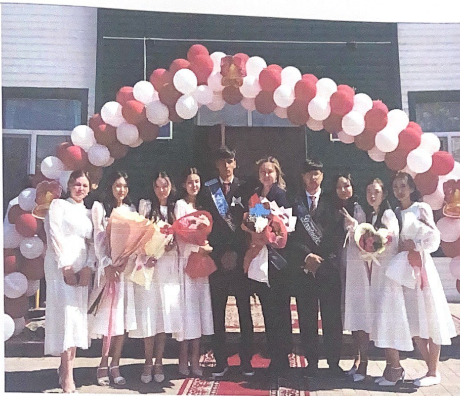
«Мектебім саған мың алғыс» атты түлектерге арналған салтанатты жиын