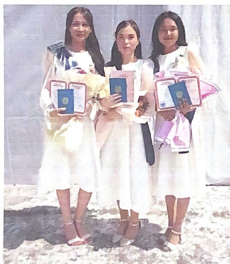
Үш «Алтын белгі» иегері