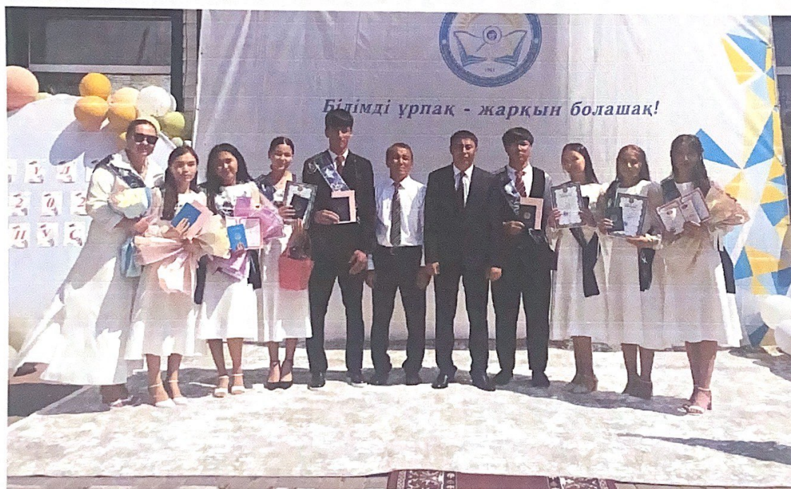
«Жолың болсын, жас түлек» атты аттестат табыстау іс-шарасы