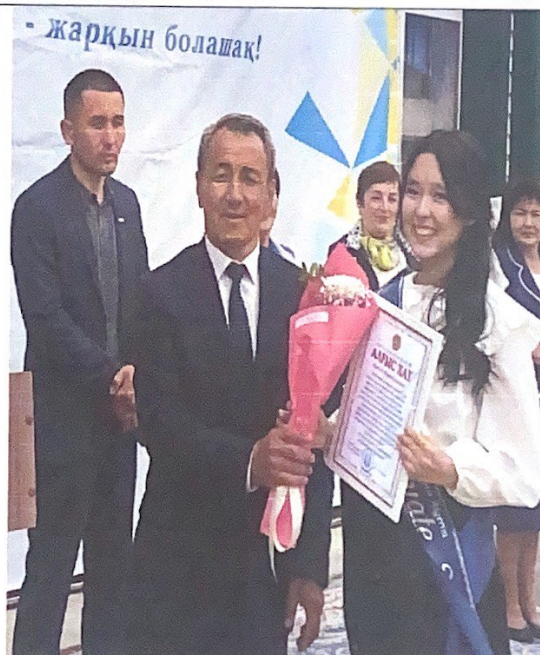
Оқушыларды марапаттау сәті