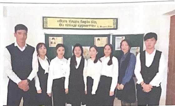
«Тәуелсіздікүрнақтары» атты тәрбиесағаты