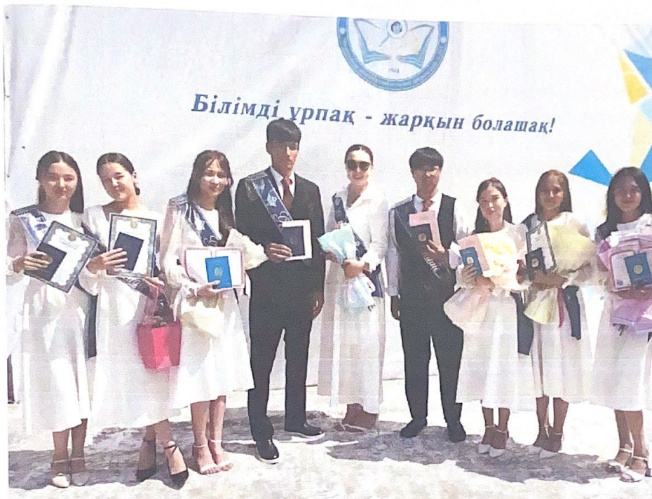
«Жоың болсын, жас түлек» атты аттестат табыстау іс-шарасы